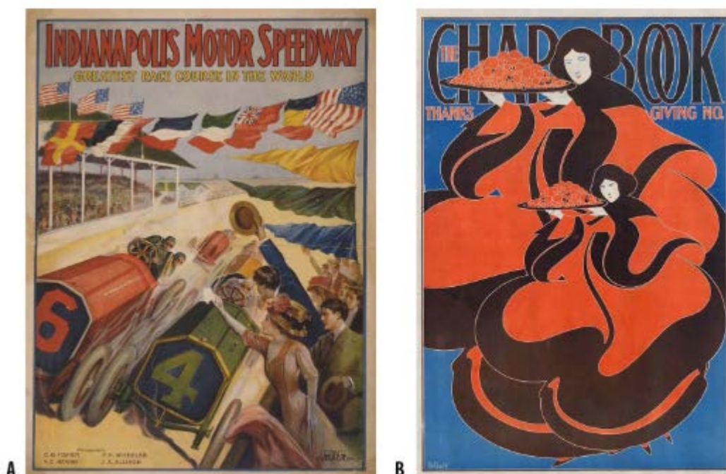
Figura 2 A evolução da visão no cartaz moderno. Esquerda: Indianapolis Motor Speedway, 1909. Direita: The Chapbook, 1895. Links acessados em 14 mar. 2019.

No design gráfico, encontramos a influência desse discurso na produção de cartazes do final do século XIX e início do XX. Na Figura 2, compara-se um cartaz, Indianapolis Motor Speedway , feito em 1909 para a divulgação de uma corrida automobilística norte americana, onde a representação é tridimensional e realista (A), com o cartaz produzido em 1893 pelo diretor de arte Will Bradley para a revista The Chap-Book , que publicava a literatura de vanguarda europeia (B). A representação de Bradley se distancia de uma representação tridimensional em prol de uma representação bidimensional, o que significa para os vanguardistas a evolução da visão em relação ao tato. A partir dessa lógica, a imagem pictórica não poderia ser julgada por critérios miméticos de semelhança, mas por uma linguagem própria da visão relacionada a uma visão pura. Por linguagem podemos entender, por ora, um sistema de categorias e regras, como são as leis gramaticais no caso das línguas.