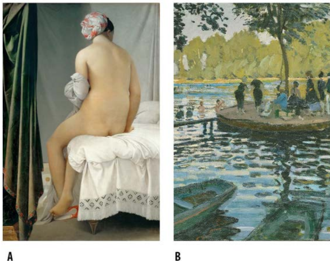
Figura 1 Da pintura acadêmica ao impressionismo. Esquerda: A banhista de Valpinçon , Jean-Auguste-Dominique Ingres, 1808. Fonte: https://commons.wikimedia.org/wiki/File:Jean-Auguste-Dominique_Ingres_-_La_Baigneuse_Valpin%C3%A7on.jpg . Direita: La Grenouillère , Claude Monet, 1869. Fonte: https://commons.wikimedia.org/wiki/File:La_Grenouill%C3%A8re_MET_DT833.jpg . Links acessados em 13 mar. 2019. Recorte elaborado pelos autores.

Para ilustrar essa concepção, podemos pensar no movimento da pintura impressionista, localizada no século XIX na França, que propunha o uso de pinceladas soltas para a representação do efeito da luz, sob o argumento de que esse tipo de abordagem representaria mais fielmente o modo como o olho humano percebe a natureza. Essa abordagem pretendia então ser mais precisa e apurada do que uma abordagem acadêmica, por exemplo, que trabalhava as pinceladas a fim de representar um objeto tridimensional. A lógica desse argumento é a de que apenas a visão, isolada do tato, representaria a verdade natural. Para exemplificar tal lógica, na Figura 1 compara-se a pintura A banhista de Valpinçon (A), do artista acadêmico Jean-Auguste Dominique Ingres, com a pintura La Grenouillère (B), do impressionista Claude Monet. Segundo o conceito da evolução da visão, a representação pictórica impressionista seria mais fiel aos efeitos da natureza e, por esse motivo, é entendida como a mais próxima da verdade.