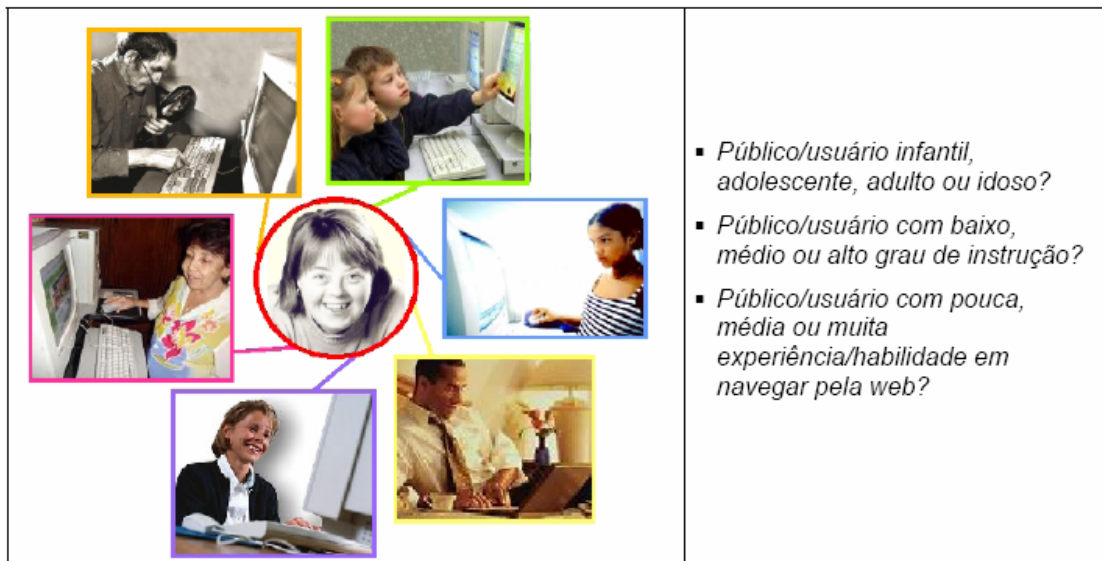
Figura 1: Painel semântico com a diversidade de usuários do web site “Diferente todo mundo é!”

Ao fazer uma prospecção sobre quem irá interagir com o sistema, é possível afirmar que qualquer pessoa que necessite de informações sobre síndrome de down e/ou tenha interesse em saber sobre esse assunto poderá acessar o web site.