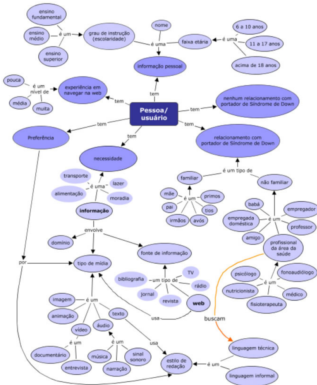
Figura 2: Mapa Conceitual – Identificação e contexto do usuário do web site “Diferente todo mundo é!”

A partir deste estudo evidenciou-se que informações sobre usuário, tais como, faixa etária, grau de instrução/escolaridade, experiência/habilidade em navegar pela web, seriam fundamentais para compor o ‘modelo do usuário’ e, conseqüentemente, propiciar a personalização.